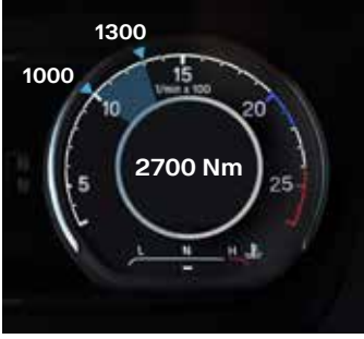
DC13 166 540 hp Euro 6

R serisi, güçlü motor seçenekleriyle, alt devirlerden itibaren yüksek tork değerlerine ulaşır. Etkin güç kullanımı sayesinde yakıt tüketiminde oldukça tutumlu davranırken istediğiniz yükü taşımak için kesintisiz ve yüksek performans sağlar.