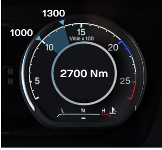
DC13 166 540 hp Euro 6

S serisi, güçlü motor seçenekleri sayesinde, alt devirlerden itibaren yüksek tork değerlerine ulaşır. Etkin güç kullanımı sayesinde yakıtı oldukça tutumlu bir şekilde tüketirken sunduğu kesintisiz ve yüksek performansla istediğiniz miktarda yükü taşır.